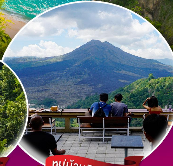
หมู่บ้านคินตามณี